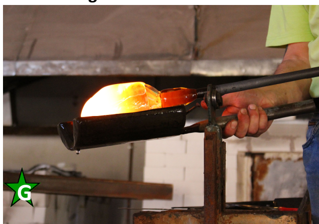
Les Verriers de St André