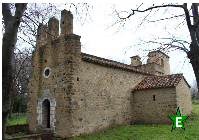
Chapelle de Cabanes (St Genis)