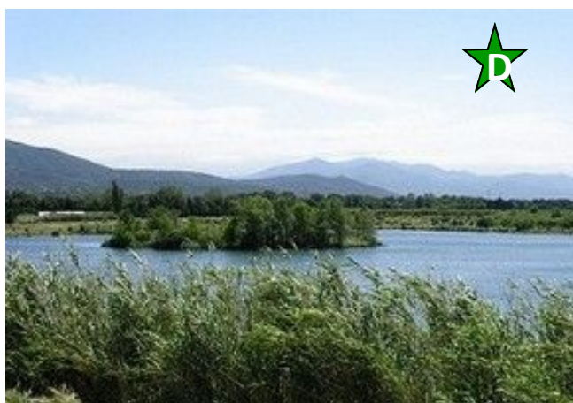
Le lac (Villelongue)