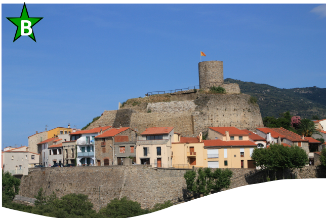
Belvédère du château (Laroque)